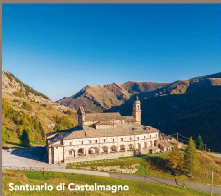
Santuario di Castelmagno

A Castelmagno la Valle si apre in tutto il suo fascino alpino, e ancora oltre dove il colle Fauniera è meta ambita dagli sportivi e congiunge la Valle Grana con le vicine Stura e Maira.